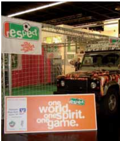
Der WFLV ist mit seiner Image-Kampagne „respect“ auf der Messe vertreten. Ein Besuch an unserem Stand lohnt sich.

Wie gewohnt trifft sich das Who is Who der internationalen Sport- und Freizeitindustrie an allen drei Messtagen im Rahmen des IAKS Kongresses zum interdisziplinären Austausch. Hochkarätige Referenten sprechen auf der renommierten Veranstaltung zu aktuellen