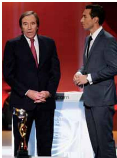
WFLV-Legende Günter Netzer (Links) als „Glücksfee“ für die Frauen-WM