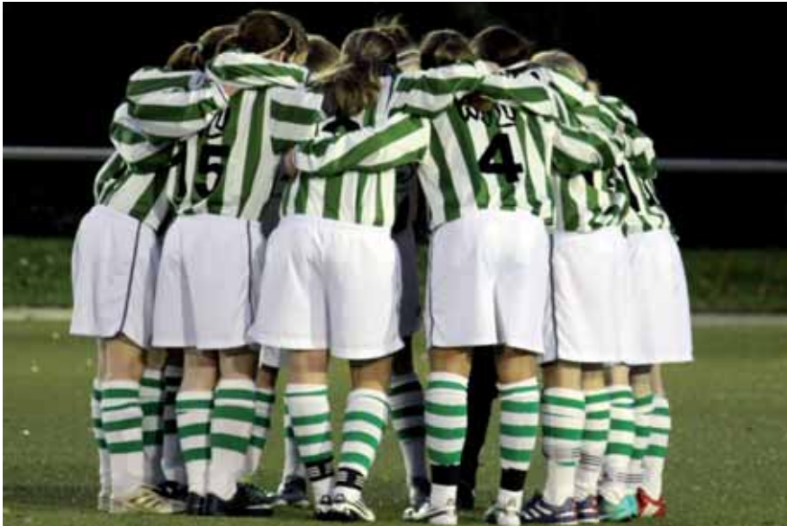
Teamgeist bei den WFLV-Mädchen

viele Top-Spielerinnen hervorgebracht. Einige bewegen sich auf den Spuren von Alexandra Popp; viele wollen ihr noch in die A-Nationalmannschaft folgen.