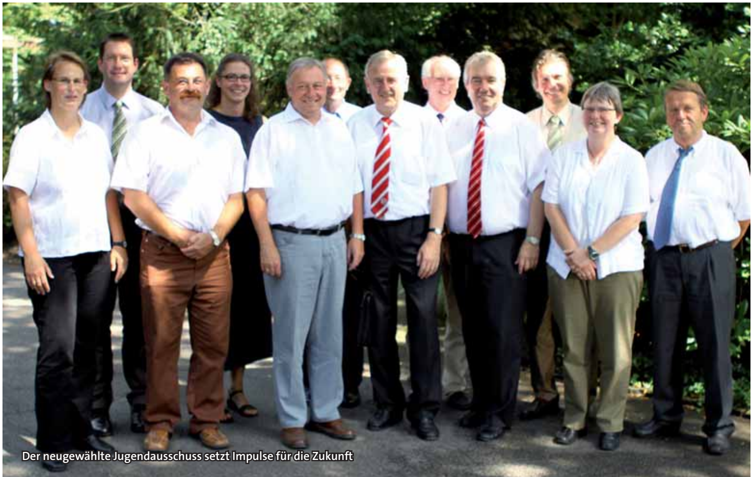
Der neugewählte Jugendausschuss setzt Impulse für die Zukunft