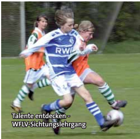
Talente entdecken - WFLV-Sichtungslehrgang