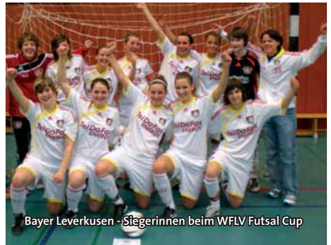
Bayer Leverkusen - Siegerinnen beim WFLV Futsal Cup