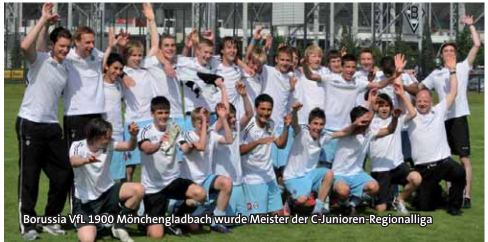
Borussia VfL 1900 Mönchengladbach wurde Meister der C-Junioren-Regionalliga