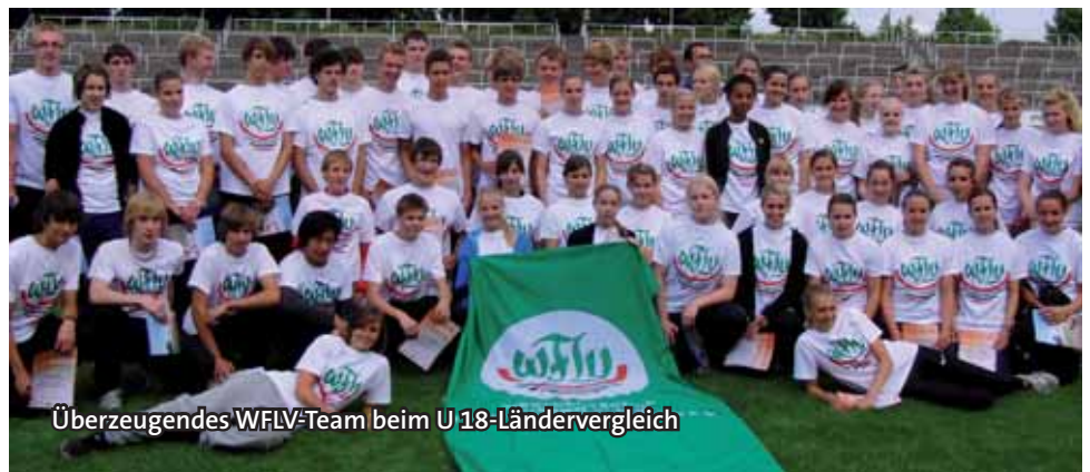
Überzeugendes WFLV-Team beim U 18-Ländervergleich