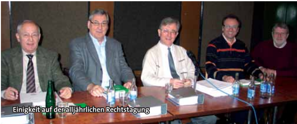
Einigkeit auf der alljährlichen Rechtstagung