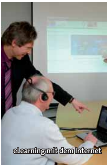
eLearning mit dem Internet