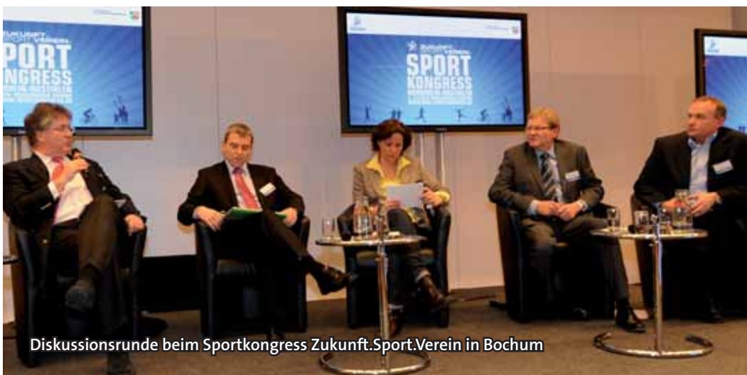
Diskussionsrunde beim Sportkongress Zukunft.Sport.Verein in Bochum