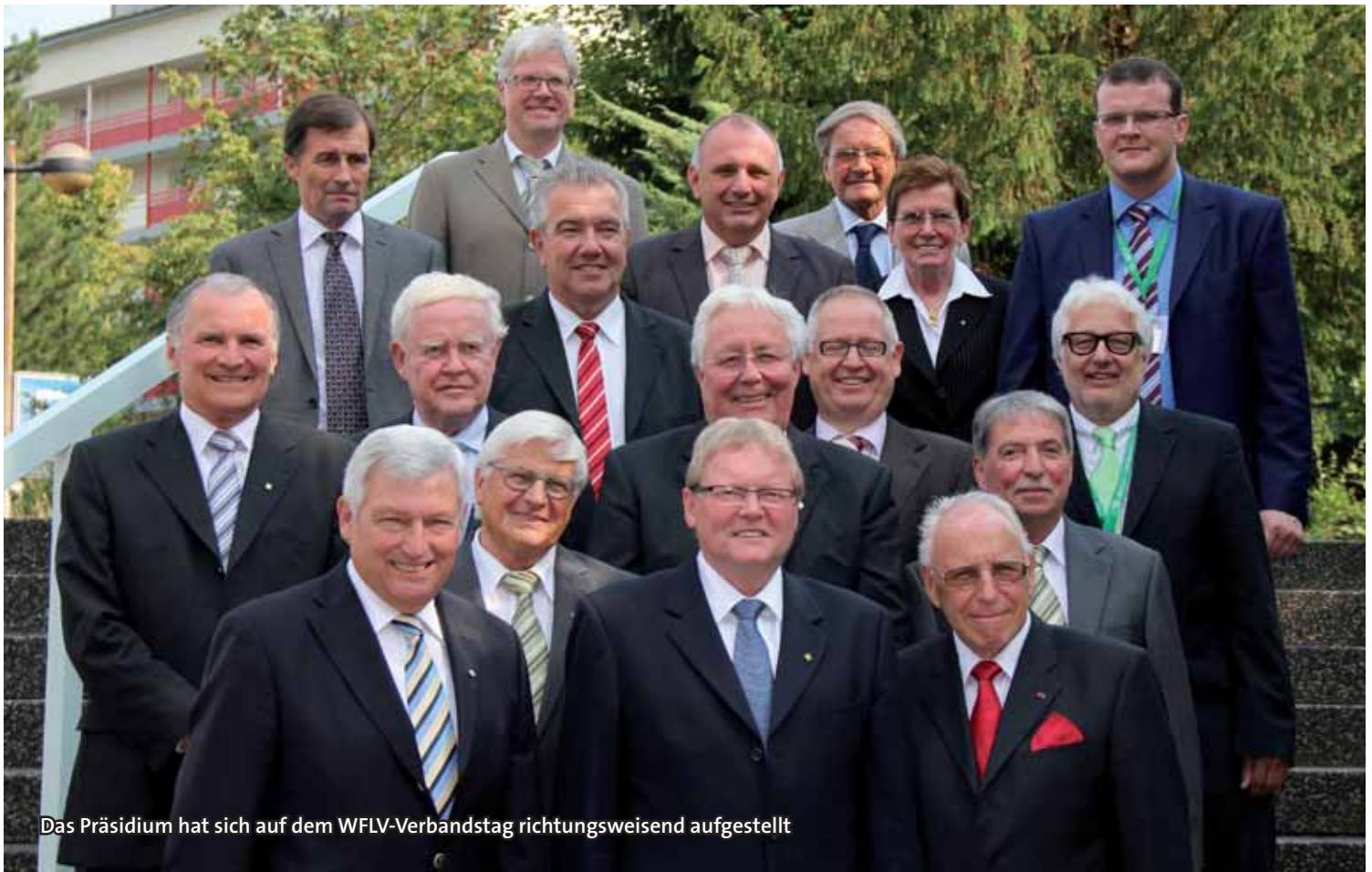
Das Präsidium hat sich auf dem WFLV-Verbandstag richtungsweisend aufgestellt