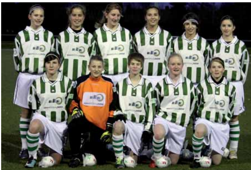
Die Mädchen-Elf des WFLV vor dem Spiel gegen die Jungenauswahl von SuS Kaiserau

Auf WFLV-Ebene finden jährlich je zwei Maßnahmen für die Altersstufen U 15 und U 17, sowie eine Maßnahme in der Altersstufe U 13 statt. Hinzu kommen Lehrgänge in den Verbänden und die dezentrale Ausbildung der Talente in den Talentförderzentren. Das Projekt ist einzigartig in Deutschland und hat bisher