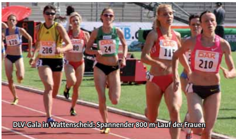
DLV-Gala in Wattenscheid: Spannender 800 m-Lauf der Frauen

Meister, Macher und Rekorde: Das nordrhein-westfälische Sportjahr 2010 stand im Zeichen herausragender Leistungen unserer Fußballer und Leichtathleten