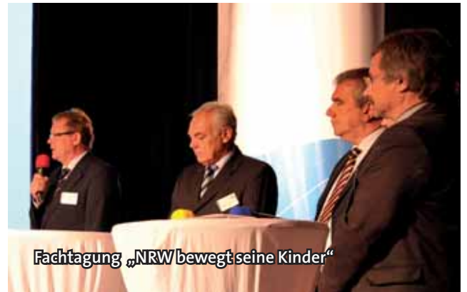
Fachtagung „NRW bewegt seine Kinder“