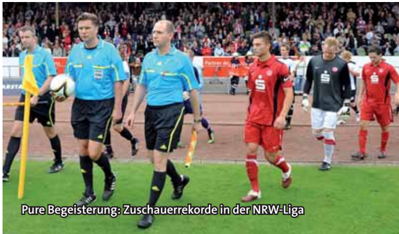
Pure Begeisterung: Zuschauerrekorde in der NRW-Liga