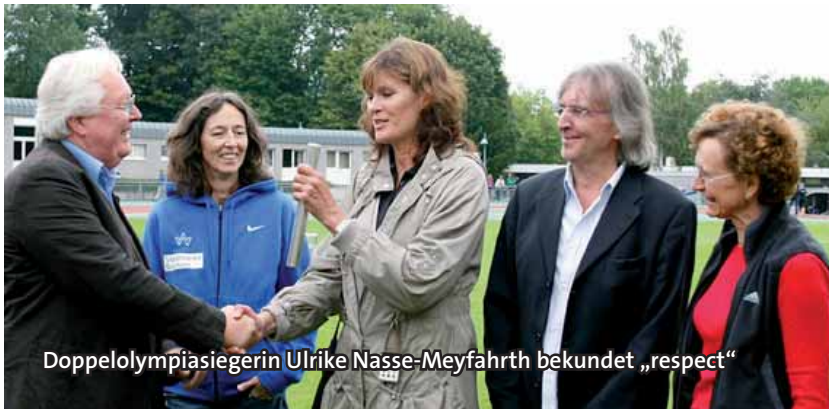
Doppelolympiasiegerin Ulrike Nasse-Meyfährth bekundet „respect“