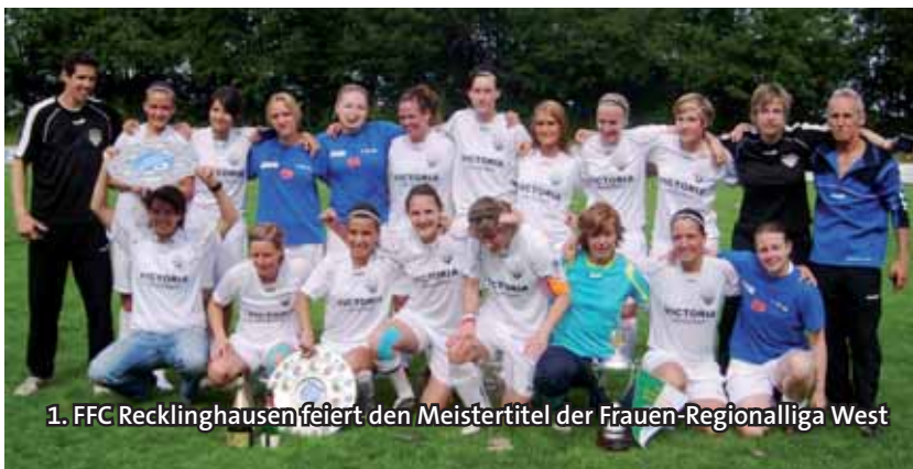
1. FCC Recklinghausen feiert den Meistertitel der Frauen-Regionalliga West