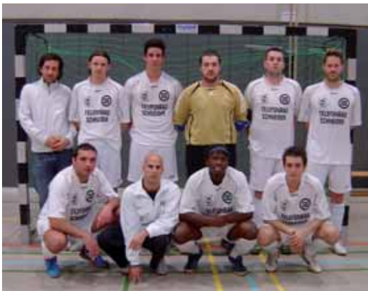
Ein starkes Team - die Futsal Lions Düsseldorf