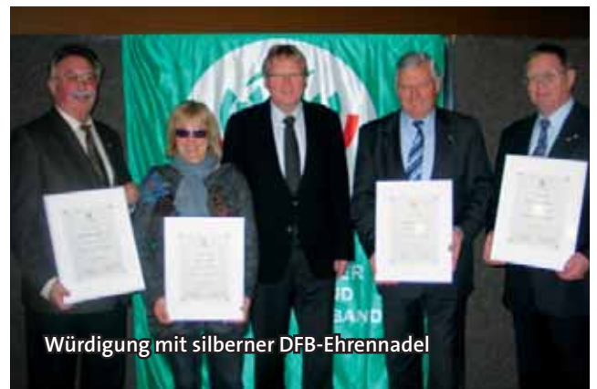
Würdigung mit silberner DFB-Ehrennadel