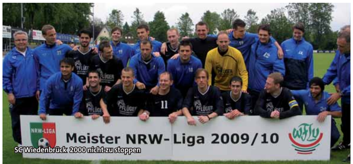
SC Wiedenbrück 2000 nicht zu stoppen