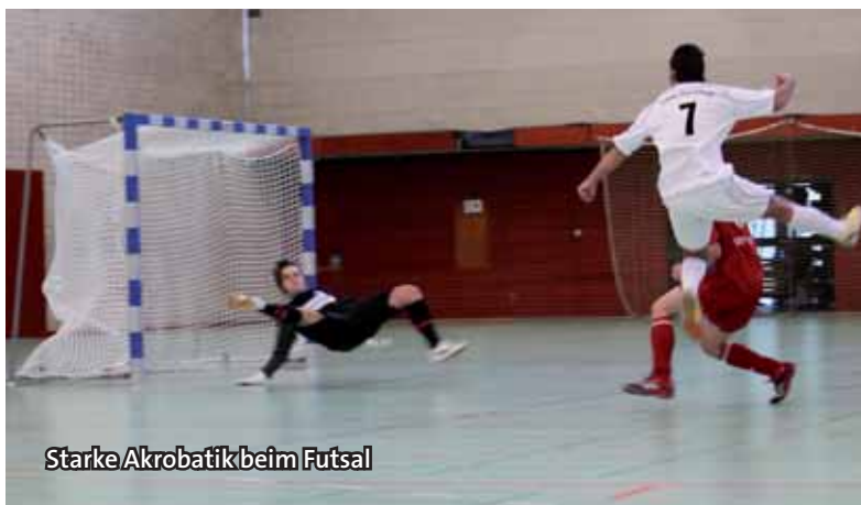
Starke Akrobatik beim Futsal

Impulse für die Zukunft wurden ebenso auf dem WFLV-Jugendtag gesetzt. Die Fachtagung „NRW bewegt seine Kinder“ beschäftigte sich in mehreren Arbeitsgruppen mit anstehenden Herausforderungen. Ein vielbeachtetes Gesamtkonzept für die Leistungssportförderung der Leichtathletik in NRW ging 2010 an den Start.