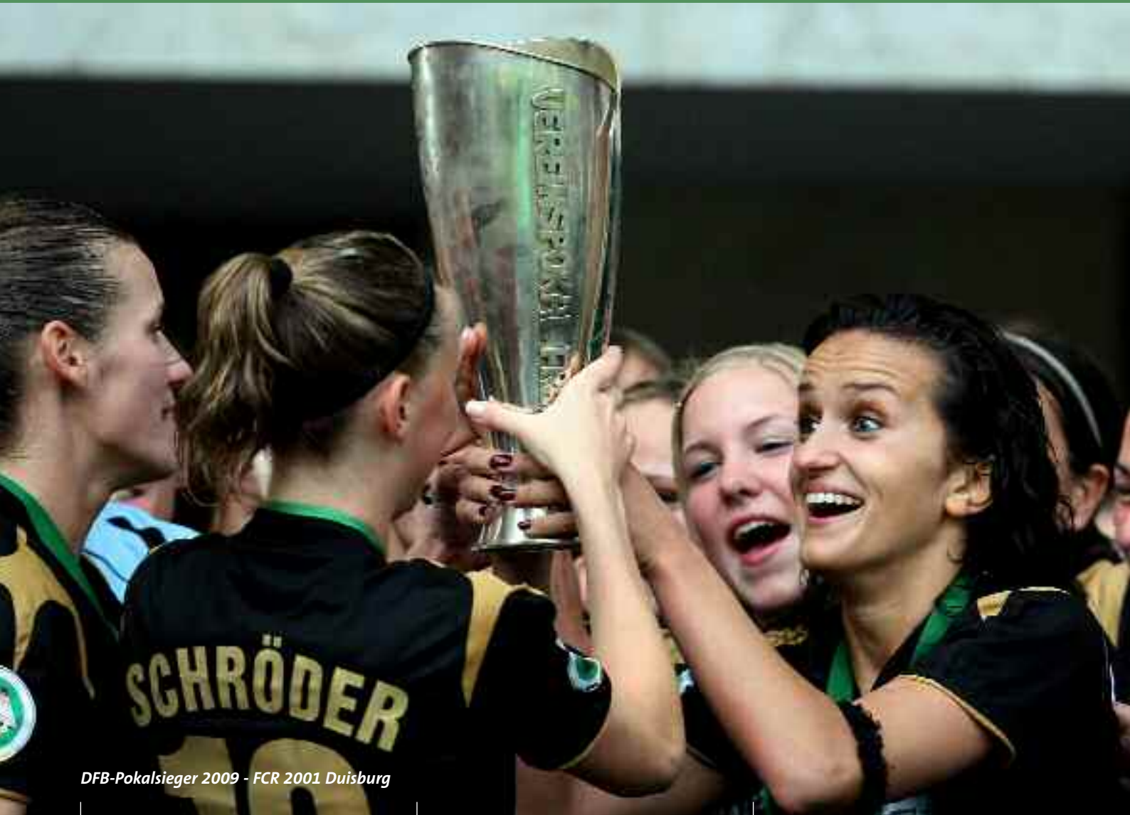
DFB-Pokalsieger 2009 - FCR 2001 Duisburg