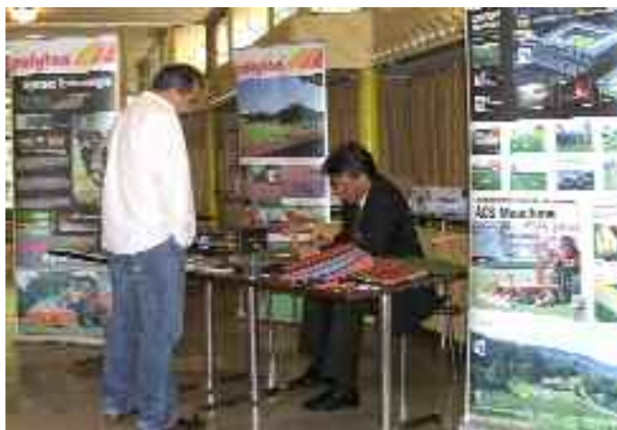
Fachberatung bei Polytan®