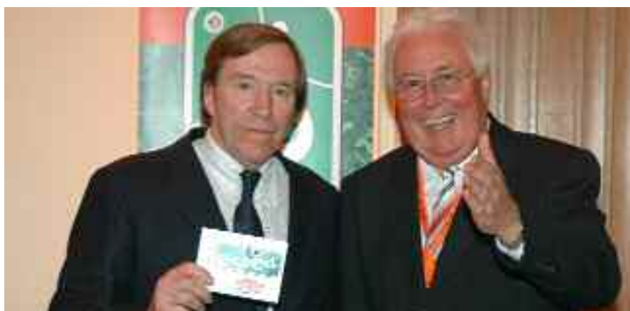
Klaus Jahn gewinnt Günter Netzer als "Prominenten für respect".