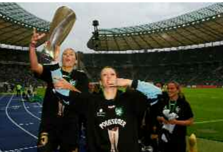
Duisburgerinnen holen sich den DFB-Pokal

Niemand hatte erwartet, dass Duisburg den dreimaligen DFB-Pokalgewinner Potsdam nur acht Tage nach dem ersten UEFA-Cup-Triumph derart überrollen würde. „Besser und schöner kann man eine Saison nicht beenden“, sagte Spielführerin Inka Grings. Die Torjägerin steuerte nach der Pause zwei Tore zum klarsten Finalerfolg in der 28-jährigen Pokalgeschichte bei. Torhüterin Kathrin Längert gestand mit vielen Emotionen in der Stimme: „Ich habe noch nicht einmal den ersten Titelgewinn richtig realisiert.“ Den Siegerinnen war egal, dass