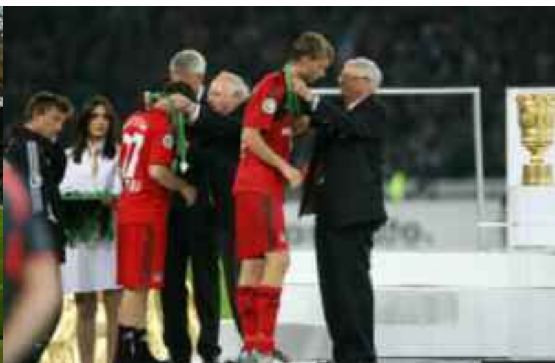
Bayer 04 wird im Finale nur Zweiter