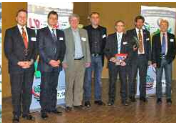
Mitglieder des Experten-/Beratungsteams