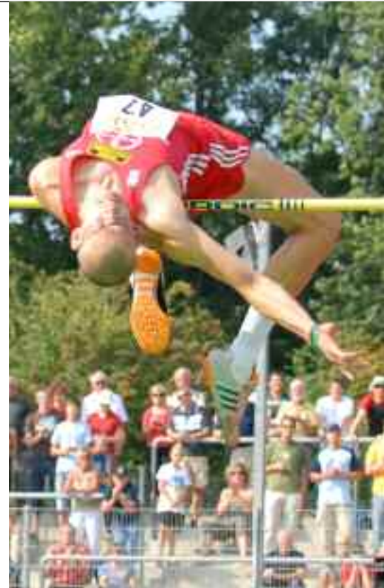
Stabhochspringer bei der RAG-DLV Gala in Wattenscheid