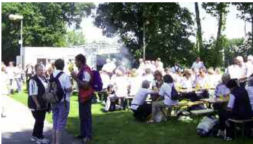
Zeit für einen intensiven Gedankenaustausch, Essen und Trinken schmecken und die Sonne lacht nur so vom Himmel

Unser Fazit: Wir nehmen von dieser Veranstaltung des LVN mit, dass den Wettkampfmitarbeiterinnen und Wettkampfmitarbeitern einmal in besonderer und wie wir meinen ansprechender Form ein verdientes Dankeschön des Verbandes für ihre ehrenamtliche Arbeit zuteil wurde und dass die Teilnehmer selbst wie auch die vielen stillen Beobachter am Rande sich durchweg sehr lobend zu dem Ursprungsgedanken, „eine Super-Idee“, und zur Veranstaltung selbst geäußert haben.