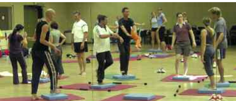
„Flexi-Bars“ im Doppelpack – eine Freude für Könnler/innen