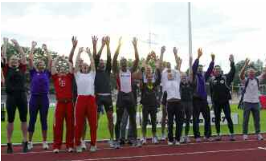
Die Leichtathleten veranstalteten eine Jubelwelle für die Teilnehmer von Osaka