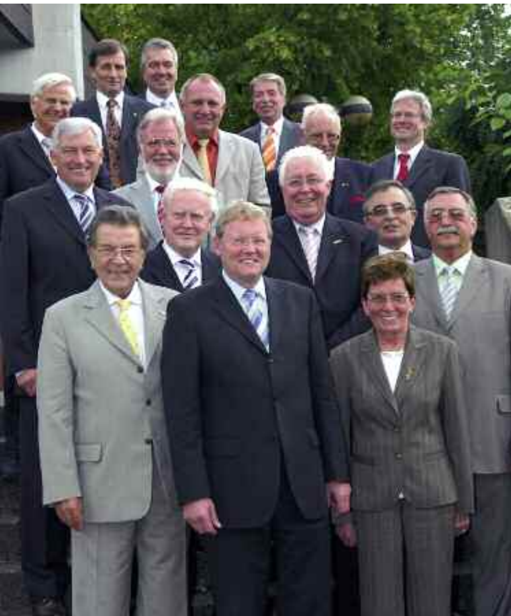
Das neu gewählte WFLV-Präsidium 2007-2010

Gesellschaft für Verbandsmanagement (DGVM) und die Verleihung des „audit berufundfamilie“ der Hertie-Stiftung, durch Bundeswirtschaftsminister Michael Glos hervor.