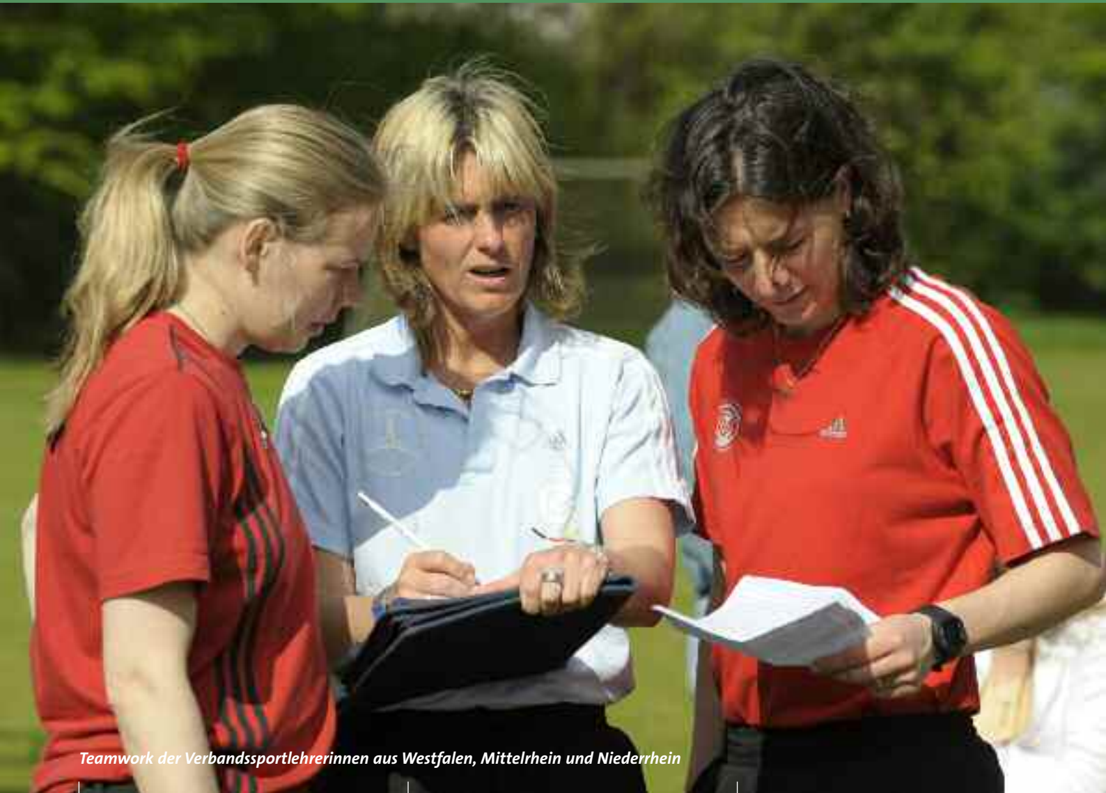
Teamwork der Verbandssportlehrerinnen aus Westfalen, Mittelrhein und Niederrhein